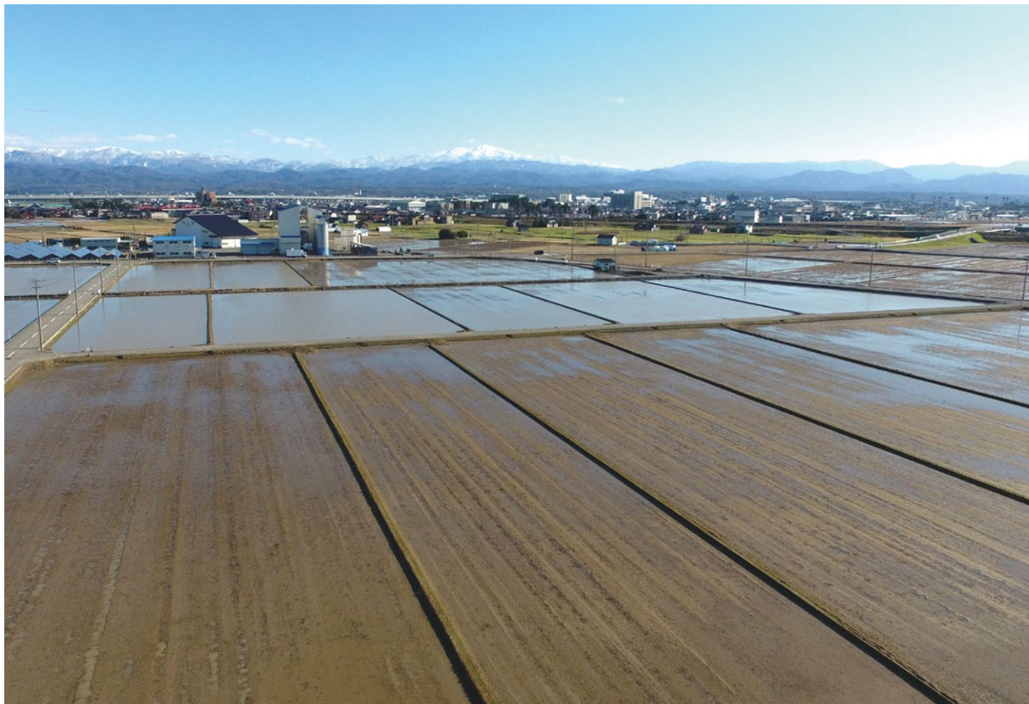
小島揚水機場周辺の冬季湛水の様子（背景は白山の山並み） 【小松市小島町地内】